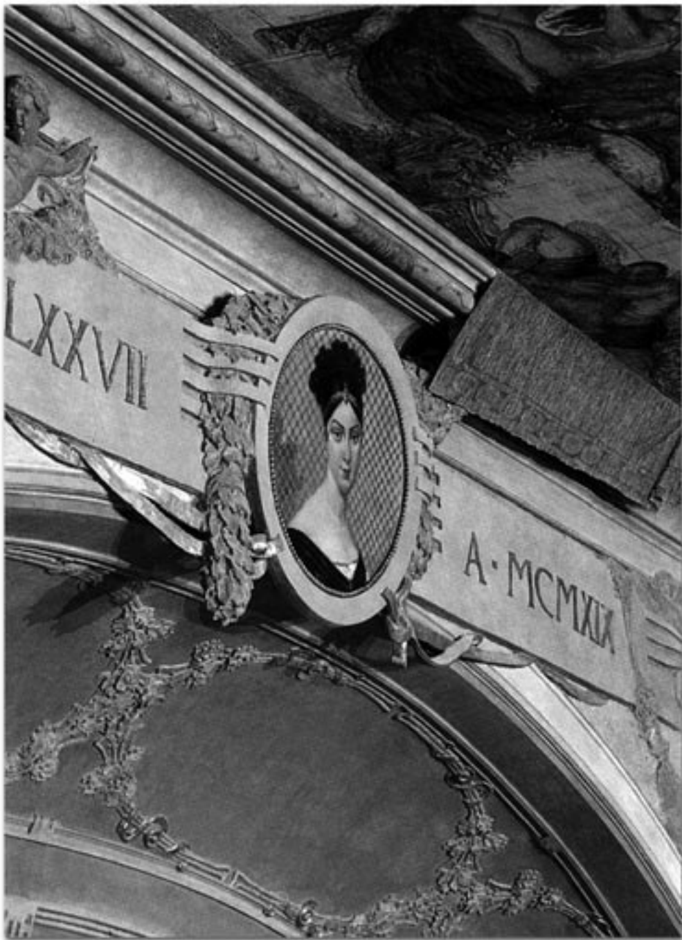
Teatro Malibrán. Decorazione dell'arcoscenico. Da Teatro Malibrán. Venezia a San Giovanni Grisostomo , a cura di Maria Ida Biggi e Giorgio Mangini, Venezia, Marsilio, 2001.