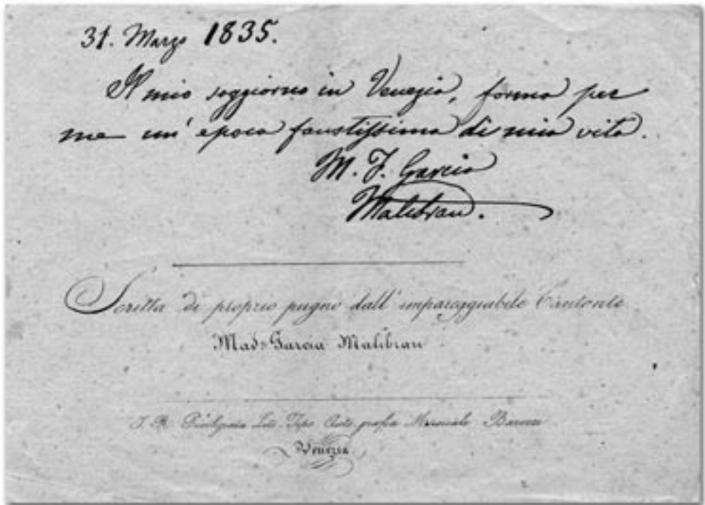
Autografo di Maria Malibran, datato 31 marzo 1835: «Il mio soggiorno in Venezia, forma per me un'epoca faustissima di mia vita. M. F. Garcia Malibran». Archivio storico del Teatro La Fenice.