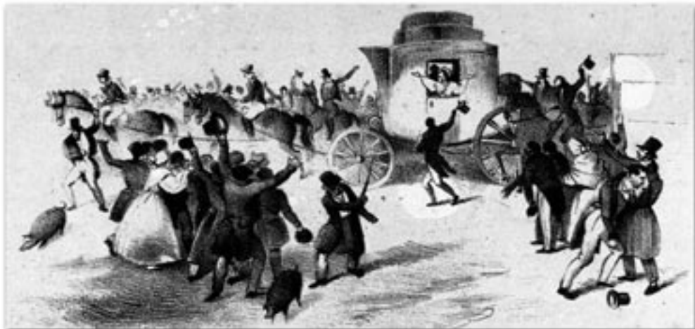
Maria Malibran a Venezia e La folla plaudente al passaggio della carrozza con la Malibran. Incisioni. Milano, Civica raccolta di stampe Achille Bertarelli.